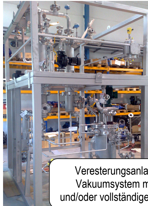
Veresterungsanlage inklusive Vakuumsystem mit teilweiser und/oder vollständiger Kondensation