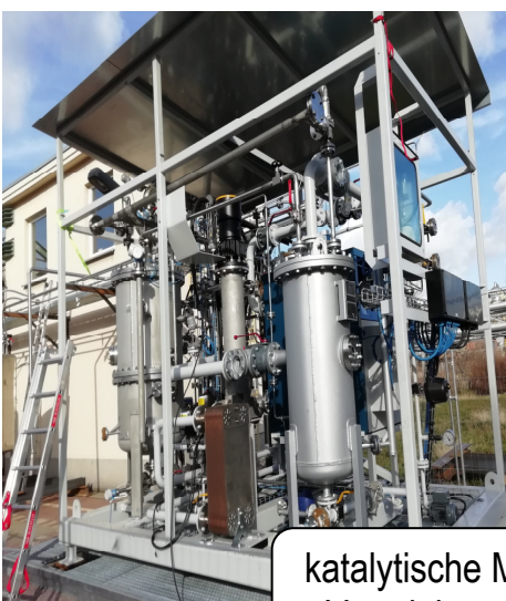
katalytische Mineralöl- Veredelungsanlage